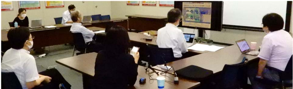
会場風景（当協会会議室）

光産業技術標準化会の 2020 年度の総会を、2020 年 7 月 30 日（木）、Web 会議にて、32 名の参加者の下、開催した。